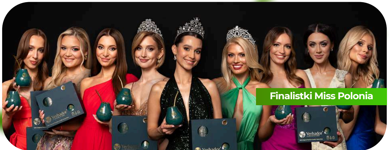
Finalistki Miss Polonia